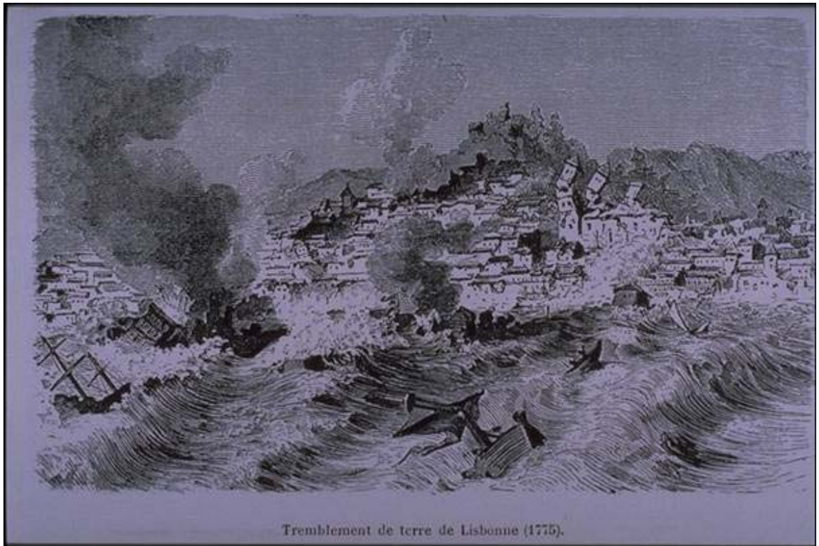
Obr. 1. Dobová rytina zkázy Lisabonu r. 1755 ze sbírky historických vyobrazení zemětřesení Jana Kozáka.

Santorini je skupina sopečných ostrůvků v Egejském moři asi 75 km od řeckého pobřeží. Největší ostrov tohoto souostroví se jmenuje Théra. Na něm vybuchla kolem r. 1650 př.n.l. sopka a vyvrhla do vzduchu asi 30 km 3 materiálu. Podle vulkanologů se tato erupce zařadila svou mohutností mezi nejsilnější za posledních 10000 let. Úbytek tak velkého objemu magmatu vedl ke zhroucení svahů sopky a vytvoření kaldery. Erupce, kolaps, atmosférické tlakové vlny a možná i silné pomořské zemětřesení vyvolaly silné tsunami. Vlny vysoké několik desítek metrů zasáhly severní pobřeží Kréty a zničilo minojské loďstvo. Přispěly tak spolu se silnou vrstvou sopečného popela k pádu jedné vyspělé civilizace. Vlny vysoké několik metrů zasáhly i východní Středomoří a mohly dát základ legendě o biblické potopě.